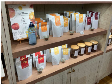
「フルーツルイボスティー」がずらり。(5種類)各50g 1,188円～ イチオシは「ピーチマンゴー」だそう。

飲む目的やシーンに合わせて最適なハーブティをスタッフに相談しながら選べるハーブティ専門店。今、ノンカフェイン飲料の人気拡大の中でじわじわ注目を集めている「ルイボスティー」で、5種類の異なるフレーバーが新登場しました。専門店ならではの技で味や香りなど飲みやすさを追求し、毎日の生活に取り入れやすくなっています。さらに、1月限定で、マリーゴールドなどフラワーハーブの華やかな見た目で気分が上がる「開運ハーブティー」も販売します。