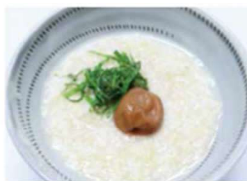
「玄米梅粥」660円 青じそと梅がのったシンプルな一品。