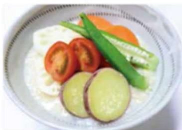
「ベジタブル粥」810円 野菜の種類は季節によって変わります。

農薬不使用栽培の玄米やオーガニックの野菜を使い、調味料や出汁にもこだわるカフェで、1月に特に人気が高まるのが玄米のお粥。玄米100%のお粥に5種類の旬の野菜がのった「ベジタブル粥」は栄養がしっかりとれ、満足感もあるので軽めのランチとしてもおすすめ。1月6日(土)、7日(日)は2日限定で「七草がゆ」も提供します。