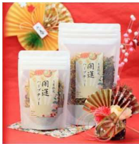
アップルティーのようにほんのり甘みを感じる「開運ハーブティー」30g 1,080円～