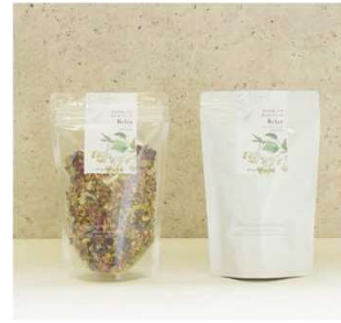
リラックスしたい時におすすめ「今日ゆっくり安らぎブレンド」ティーバッグ 1,050円～