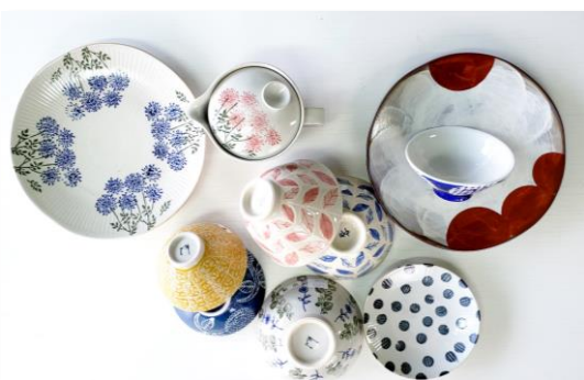
草花をモチーフにしたカラフルでポップなデザインが注目を集める「煎山(くんざん)窯」の商品も登場！